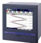
グラフィックレコーダ 記録+成分計用演算対応