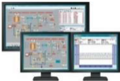
監視用パッケージソフトCISAS